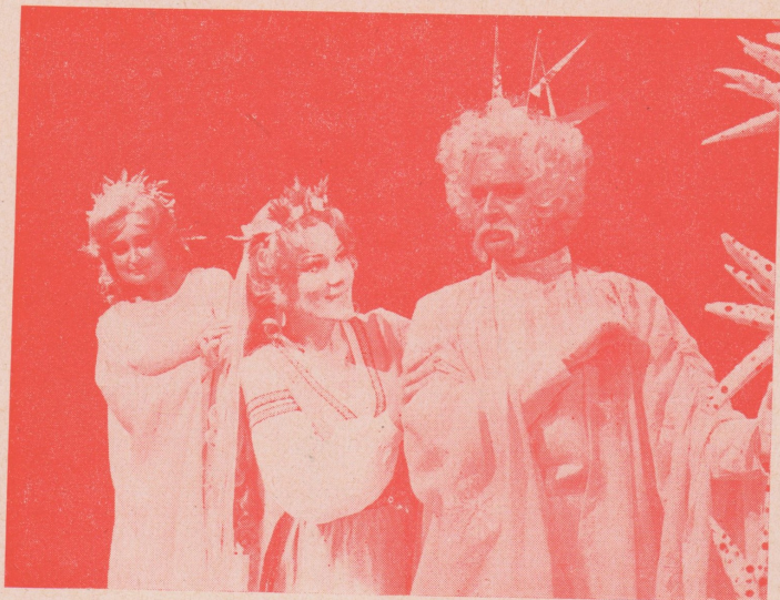
N. Rimskij - Korsakov: JARNÍ POHÁDKA (SNĚGUROČKA)