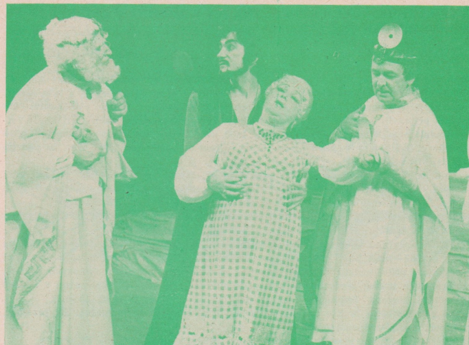
J. Offenbach: ORFEUS V PODSVĚTÍ

(S. PAPAZOVA, Narodno delo, Varna 14. 10. 1981)