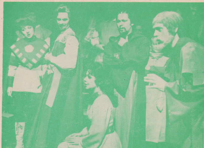
B. Smetana: ČERTOVA STĚNA