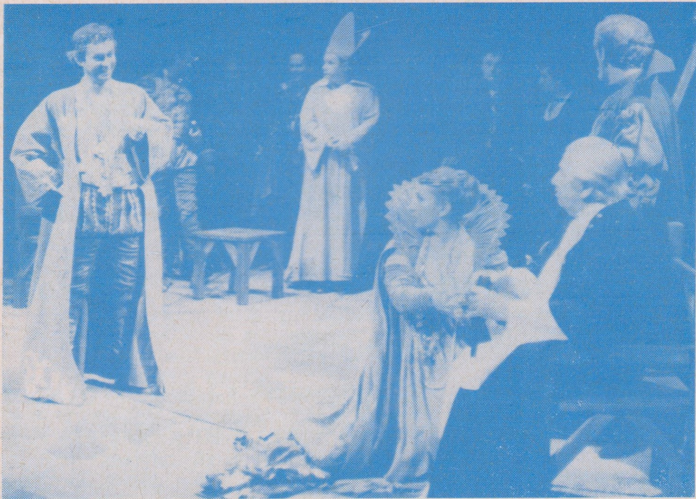
W. Shakespeare: Richard II. – činohra v DZN