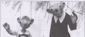
Spejbl a Hurvinek - hlavní protagonisté D S+H na pozadí Prahy.

Dětské tituly Hurvinek mezi broučky, Hurvajz nefetuj!, Jak Hurvinek hledal až našel či Jak si Hurvinek s Máničkou hráli na doktora jsou v povědomí malých diváků zapsána na jedničku. Titul pro dospělé publikum je nazván Spejbl a Hurvinek balancující a bilancující. Je inspirováno oslavou padesátileté pražské činnosti a o patnáct let starší profesionální existenci D S+H.