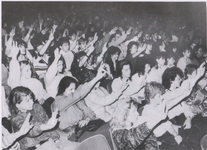
Z LISTOPADOVÝCH TRANSPARENTŮ OSTRAVSKÝCH STUDENTŮ