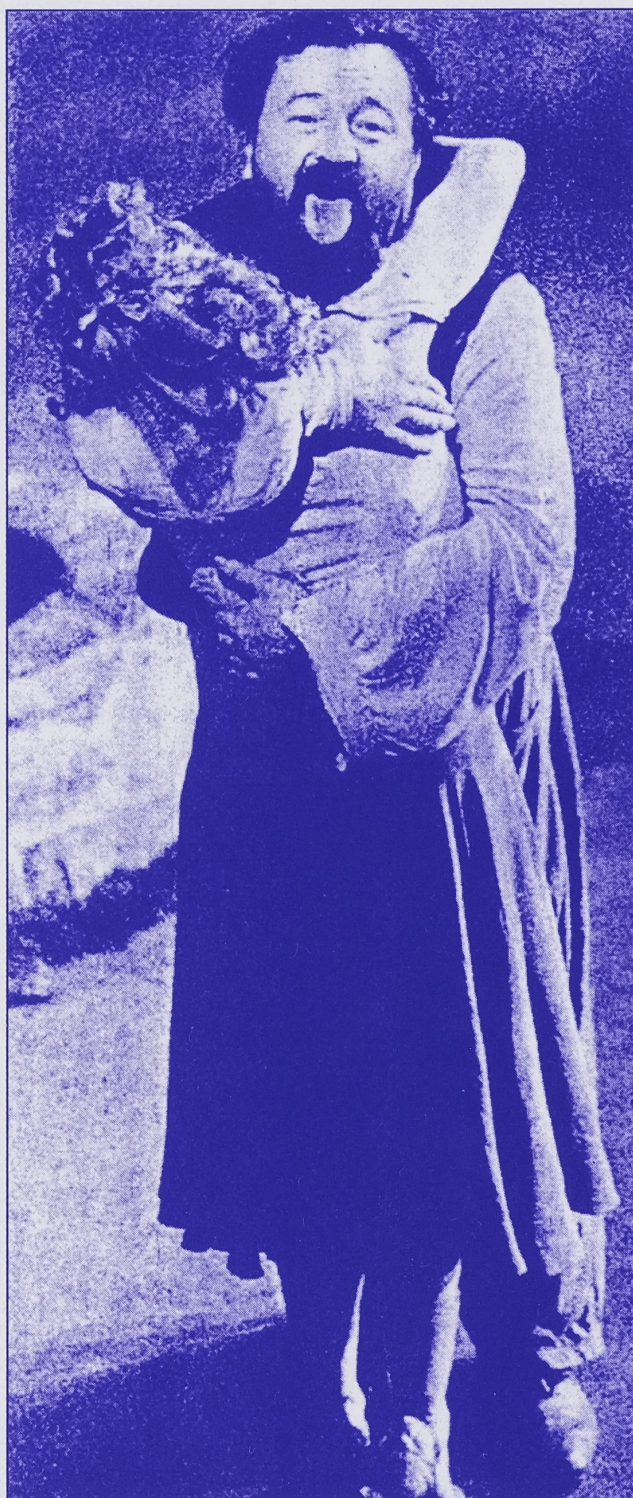
Jan Werich ve hře „Divotvorný hrnec“ na scéně Karlinského divadla v roce 1948.