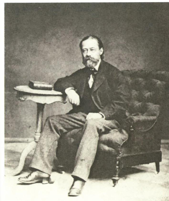
Fotografie Bedřicha Smetany z poloviny 70. let