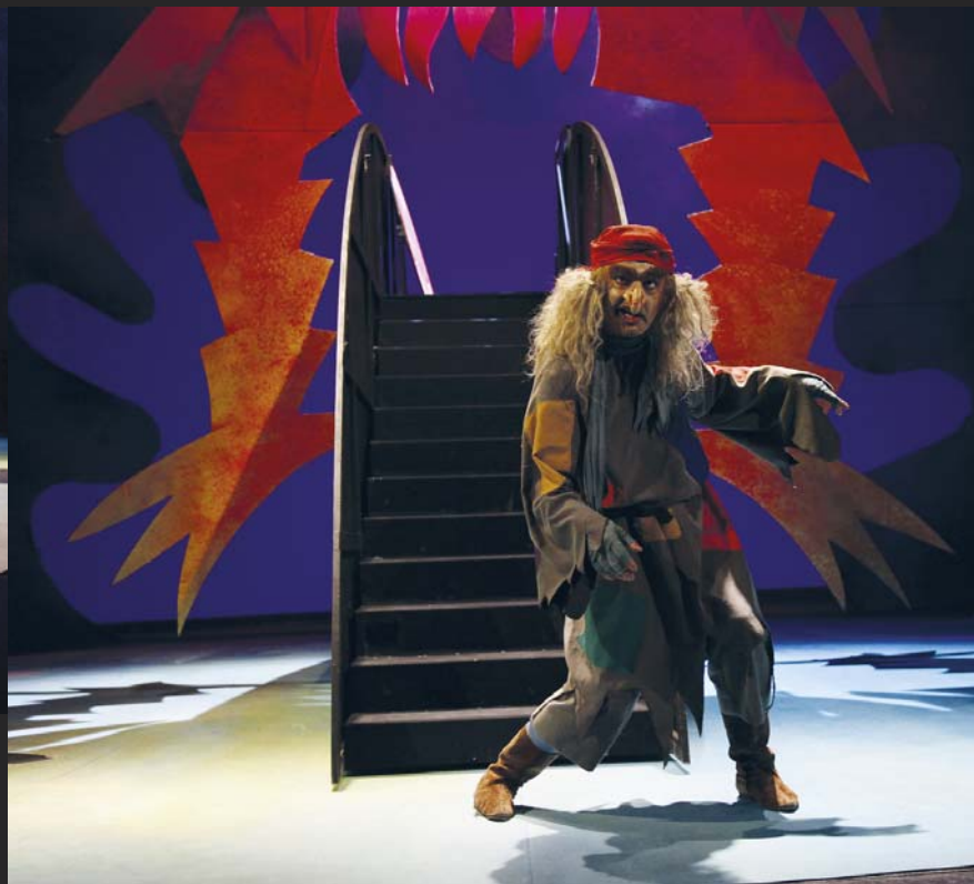
Baba Jaga – Marcel Školout