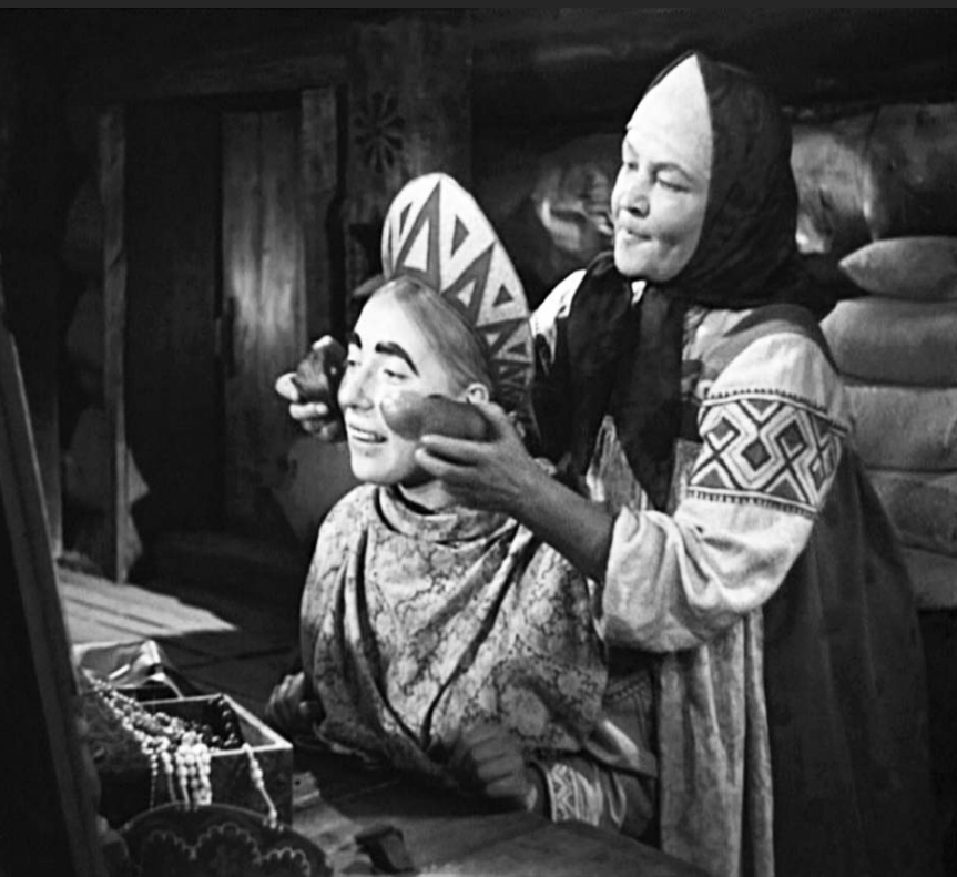
Fotografie z filmu Mrazík