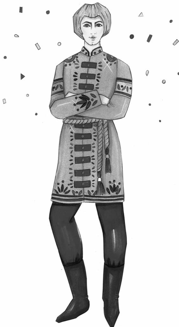
Kostýmní návrh Veroniky Babraj-Hindle Ivánek svatební