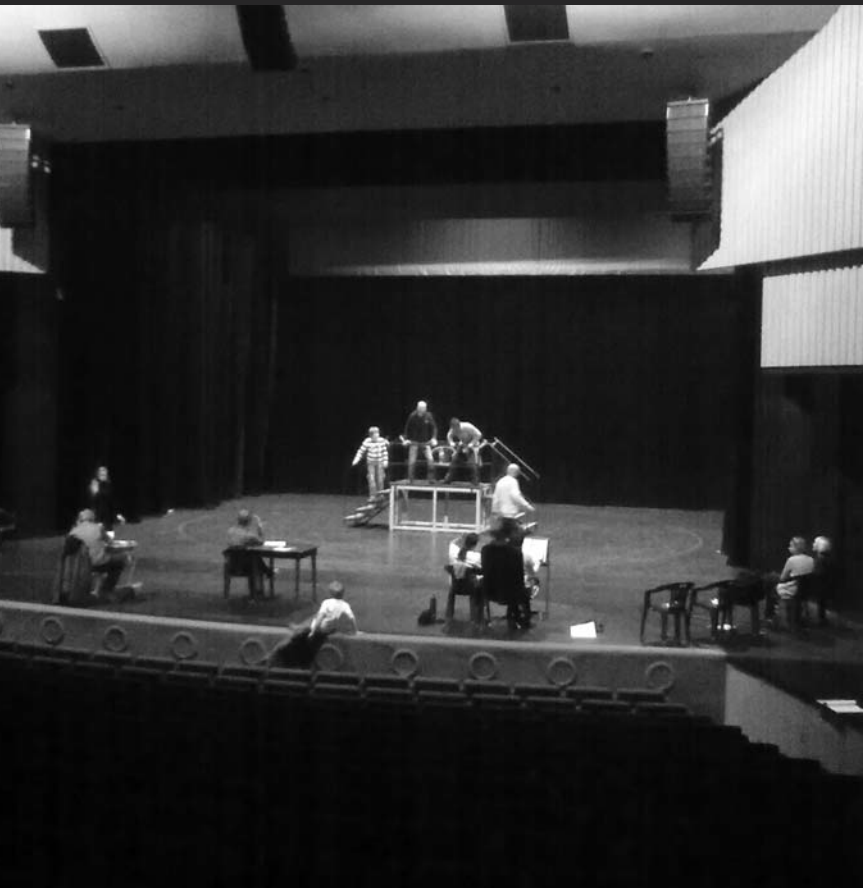
Fotografie ze zkoušky: scéna s medvědem