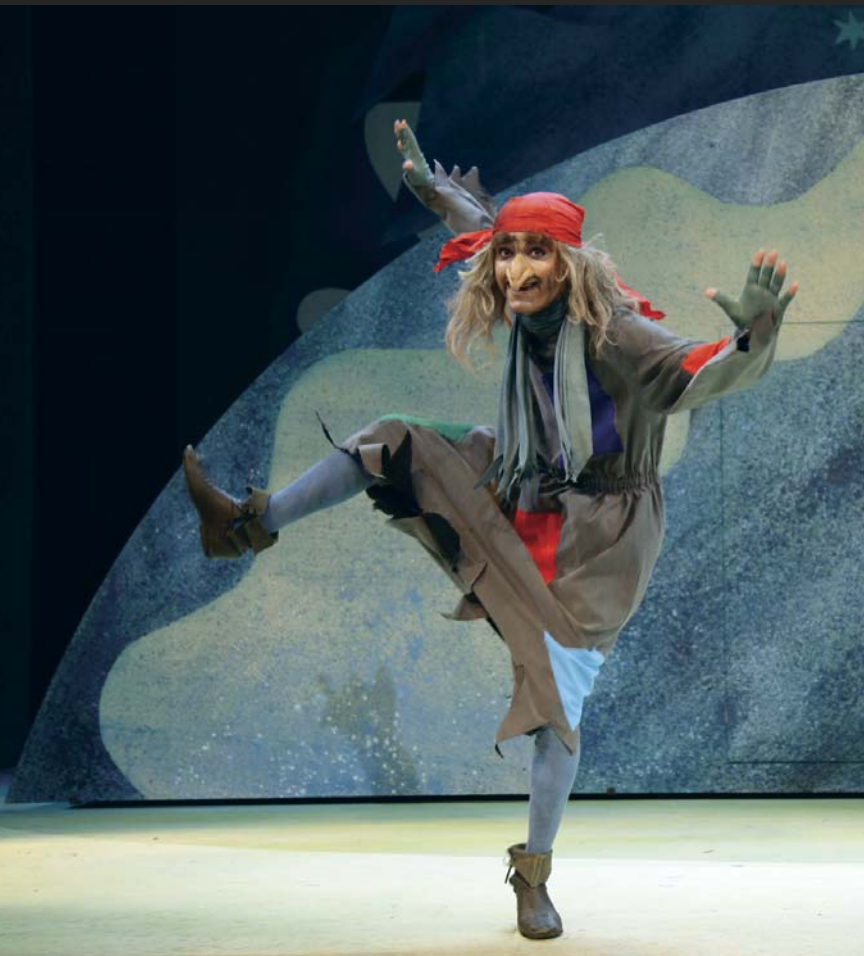
Baba Jaga – Roman Harok