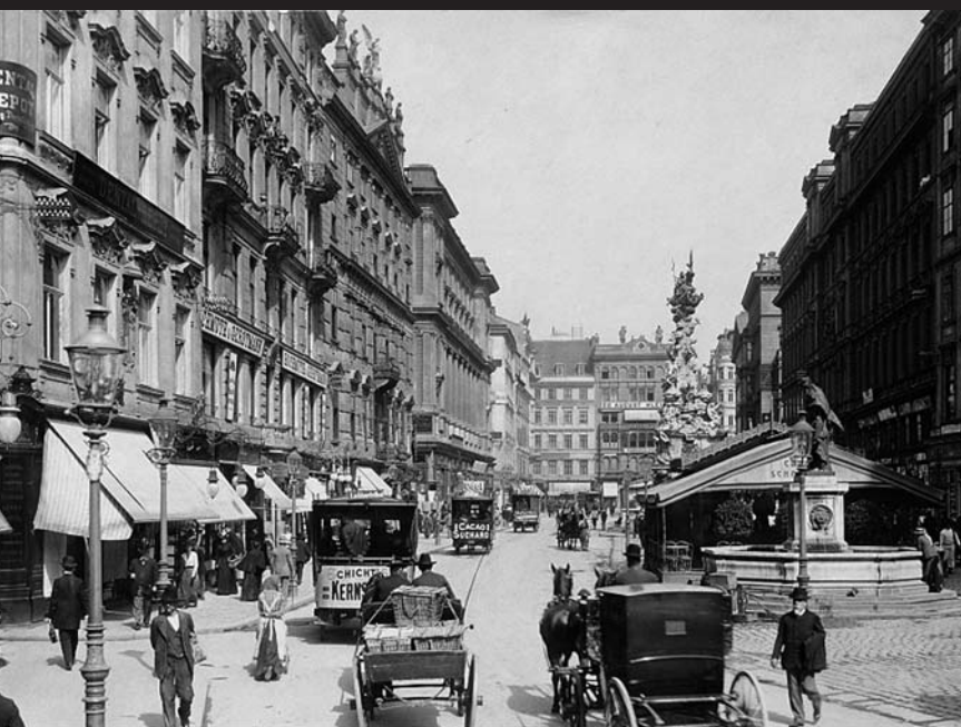
Vídeňská ulice Am Graben kolem roku 1900