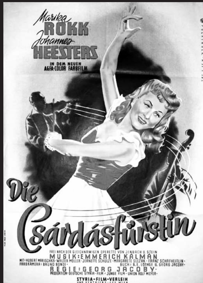
Plakát k filmovému zpracování Čardášové princezny , 1951