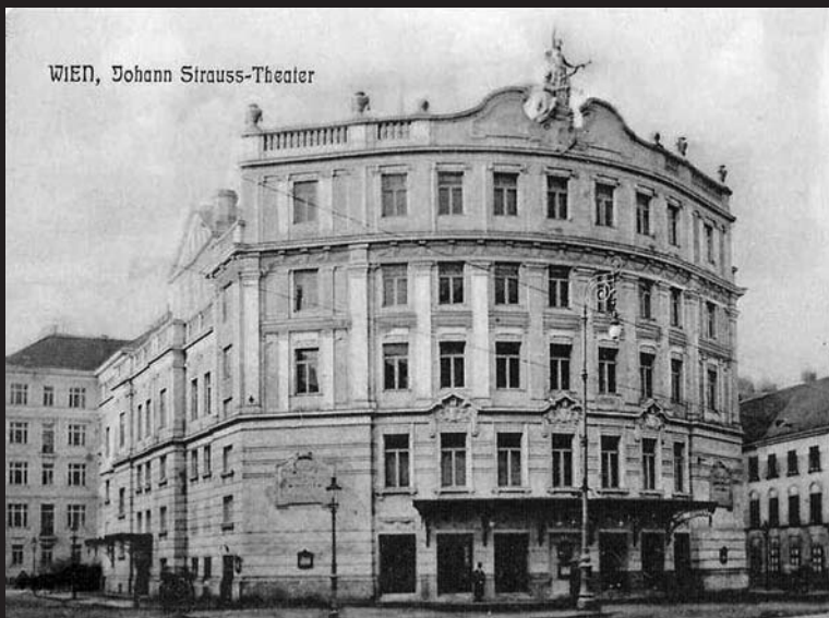
Vídeňské Divadlo Johanna Strausse