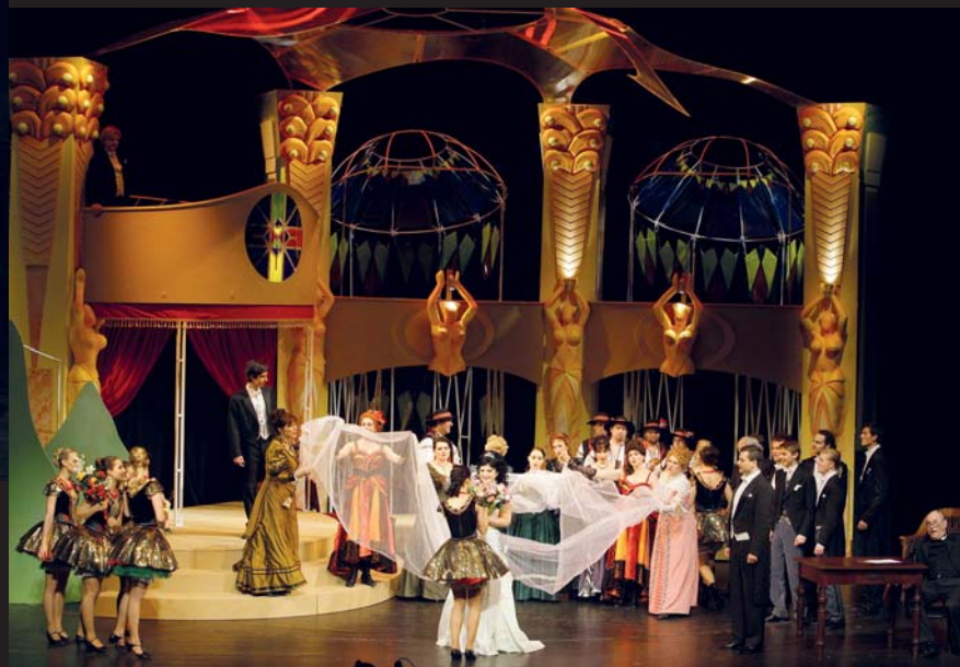
Svatební scéna v 1. dějství