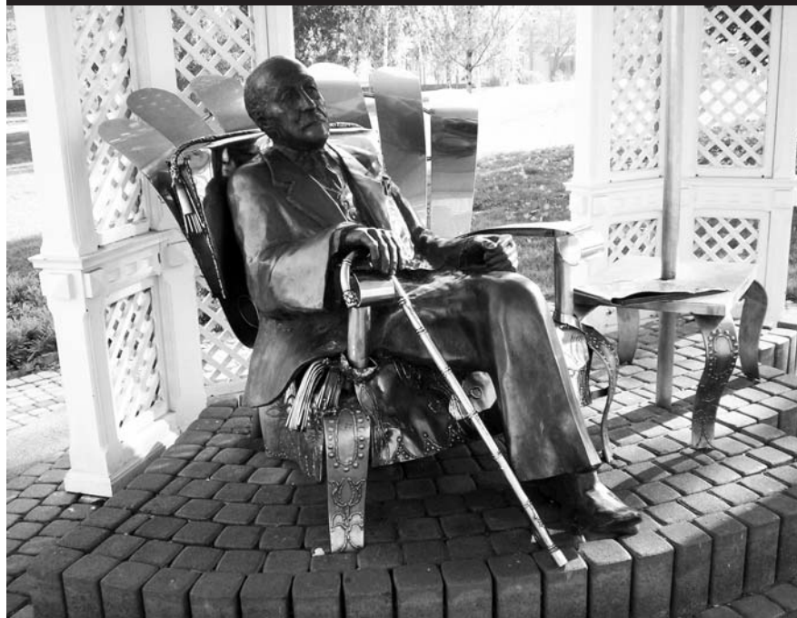
Kálmánova socha v rodném Siófoku