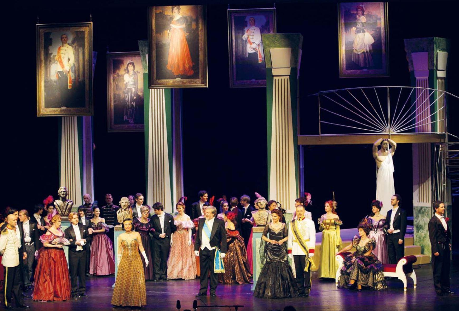
Scéna plesu v paláci knížete von Lippert-Weylersheim, 2. dějství