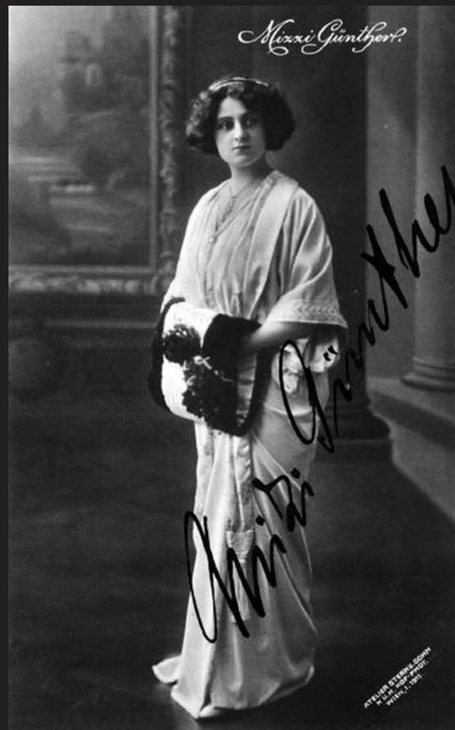
Mizzi Günther (1879–1961), první představitelka Sylvy Varescu

Čardášová princezna však i přes mnohé události 20. století, které její osudy během téměř sta let existence ovlivnily, dodnes patří mezi divácky nejoblíbenější a nejčastěji uváděné operetní tituly nejen u nás, ale po celém světě. Vždyť mnohdy tolik posmívaná láska je i v dnešní době citem nejdůležitějším.