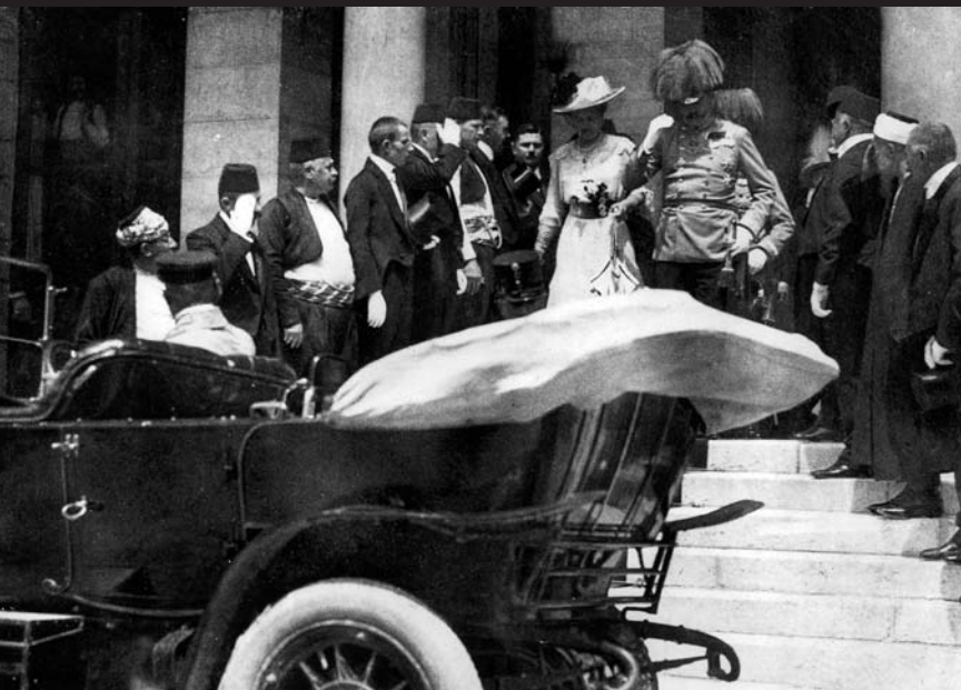
František Ferdinand d'Este se svou ženou Žofií krátce před atentátem v Sarajevu, 1914

společenské a sociální problémy. S mocným Německem jako spojencem se navíc daří mezi lidmi budit dojem, že Rakousko-Uhersko nemůže krvavý střet zakončit jinak než vítězstvím.