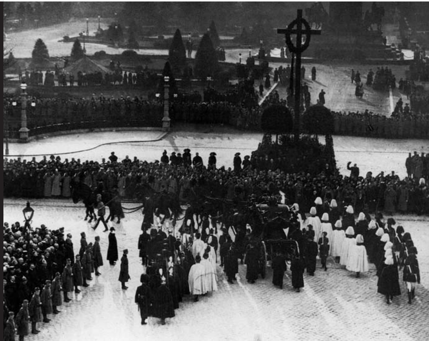
Pohřeb císaře Františka Josefa I., 1916

V úterý 21. listopadu 1916 umírá staříčkový císař František Josef I. Jeho pohřeb v sychravý a pošmourný čtvrtek 30. listopadu má téměř symbolický charakter – pro mnohé Vídeňany, kteří jdou vstříc těžkým válečným časům, je smuteční průvod doprovázející císaře na jeho poslední cestě zároveň loučením s monarchií a krásným obdobím začátku století. Zlaté staré časy jsou definitivně pryč.