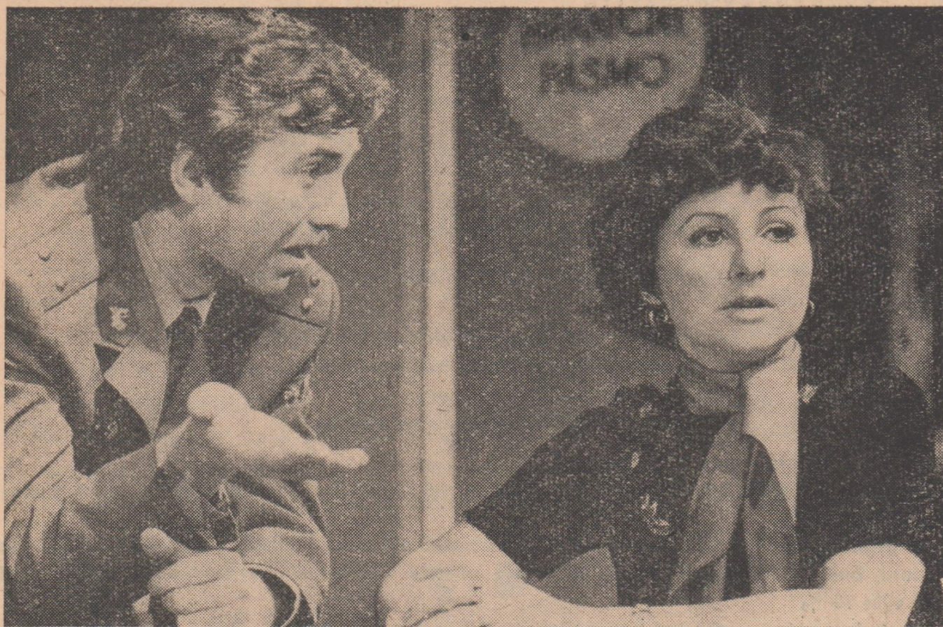
L. Veteška—F. Zacharník: HOLKY NA OCET