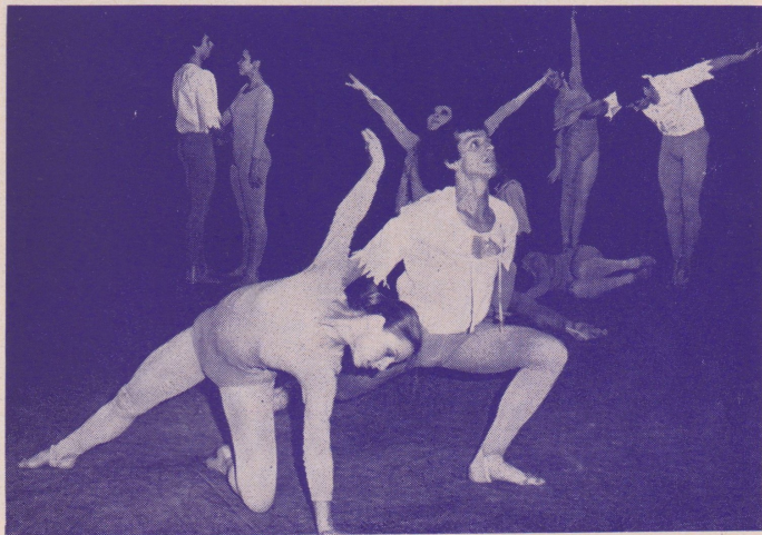
MLADÝ BALET I. — baletní koncert