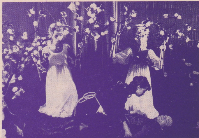
F. Hrubín: KRÁSKA A ZVÍŘE