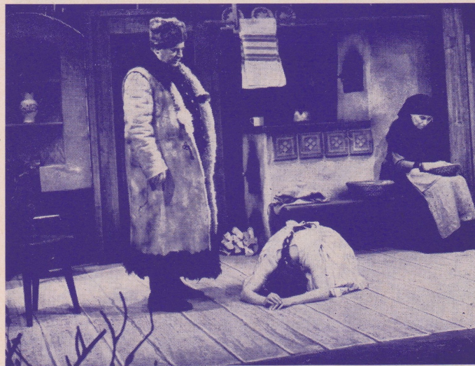
A. a V. Mrštíkové: MARYŠA