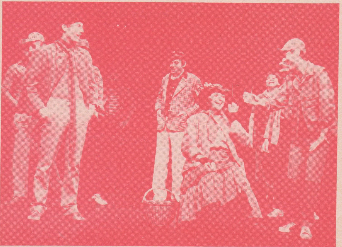
A. Fljarkovskij: DÁMA S JABLKY — muzikál — uvádí operetní soubor