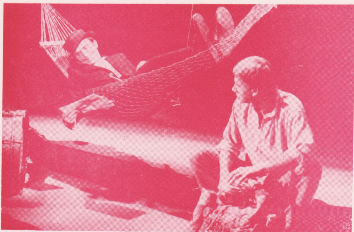
S. Šaltenis: UTÍKEJ, SMRTKO, UTÍKEJ! — činohra Petra Bezruče