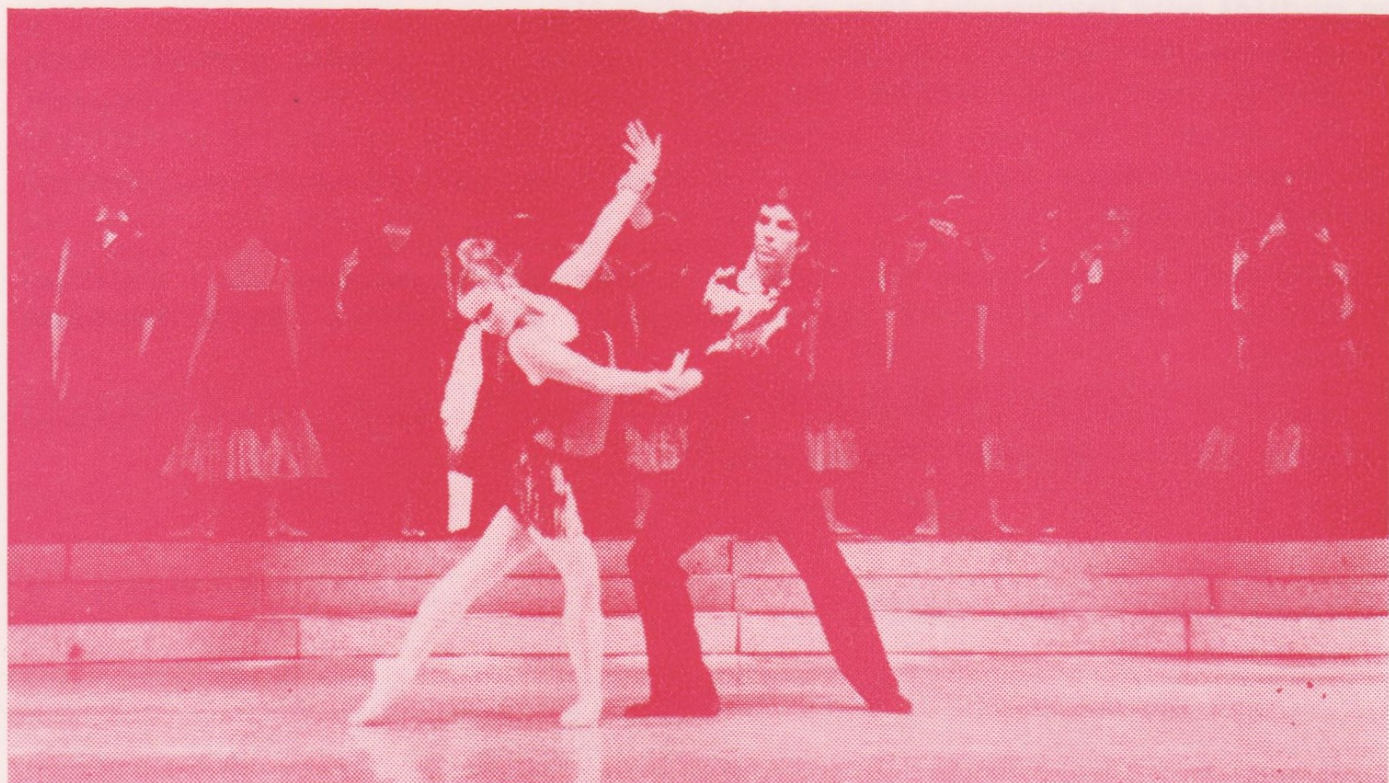
Večer tří baletů — R. Šchedrin: CARMEN — balet v Divadle Zd. Nejedlého