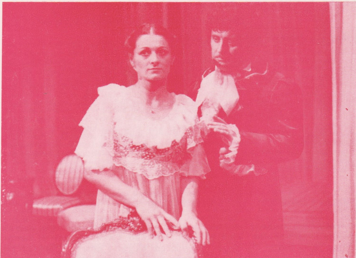
P. I. Čajkovskij: EUGEN ONĚGIN — opera v Divadle Zd. Nejedlého