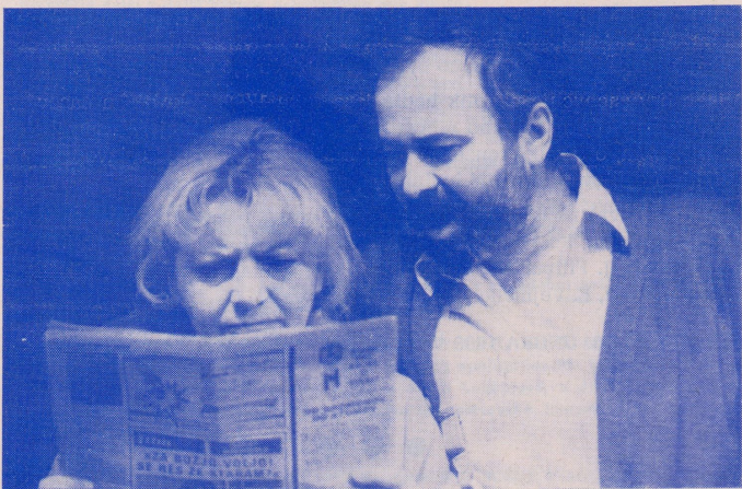
D. Kovačević: BALKÁNSKÝ ŠPIÓN (činohra v DPB) — V. Janků, O. Prajzner