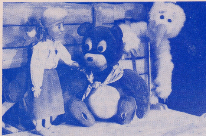
V. Vančura: KUBULA A KUBA KUBIKULA (Divadlo loutek)