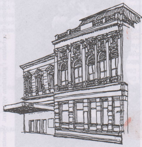
DIVADLO JIRÍHO MYRONA