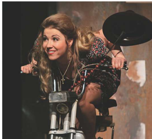
Dvě tváře Noriny v libereckém představení Dona Pasquala a temperamentní Adina v Donizettiho Nápoji lásky v pražském Národním divadle

nou a rozhodnutí o případném vstoupení do rolí proběhne na základě předzpívání. Sice je to neobvyklé po skoro deseti odpívaných sezonách v Národním divadle, ale jinou možnost zatím nemám.