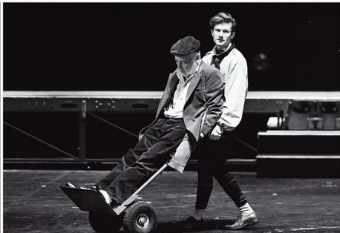
Fotbal, válka, revoluce, dvacáté století... ale hlavně Ostrava