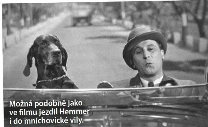
Možná podobně jako ve filmu jezdil Hemmer i do mnichovické vily.

V divadelní komedii Pučálka, člověk namětko předvedli Burian i Hemmer skvělé výkony.