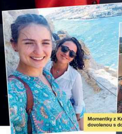
Momentky z Kréty, kde trávila dovolenou s dcerou a kamarádkami

Můj děda byl amatérský herec a režisér ve Valašské Polance, což tedy vím jen z vyprávění. Umřel totiž, když mi byly čtyři roky. Když jsme ve školce dělali představe-