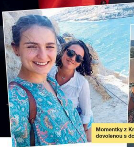
Momentky z Kréty, kde trávila dovolenou s dcerou a kamarádkami

Můj děda byl amatérský herec a režisér ve Valašské Polance, což tedy vím jen z vyprávění. Umřel totiž, když mi byly čtyři roky. Když jsme ve škole dělali představe-