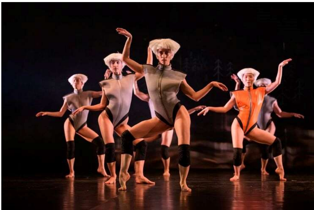
Ikarie.