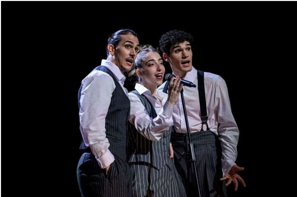
Úhel pohledu.

Střih. Po Peckově promyšlené, neoklasickým slovníkem sevřené kreaci přichází na řadu Úhel pohledu Viktora Konvalinky. Dramaturgií absentuje, tématem i formou improvizace bez mantinelů. Je to vlastně sled nesourodých scén či scének, dílčích nápadů – tu jen nahozených, jinde trochu více rozvedených. Odkazuje se na jazzovou muziku, pro níž je improvizace stavebním kamenem. Improvizace za účasti samotných tanečníků byla také metodou, jíž vznikala tato spíše performativní nežli jen taneční kreace.