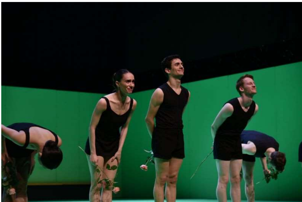
Soubor baletu NDM po představení Hora na Laterna festu