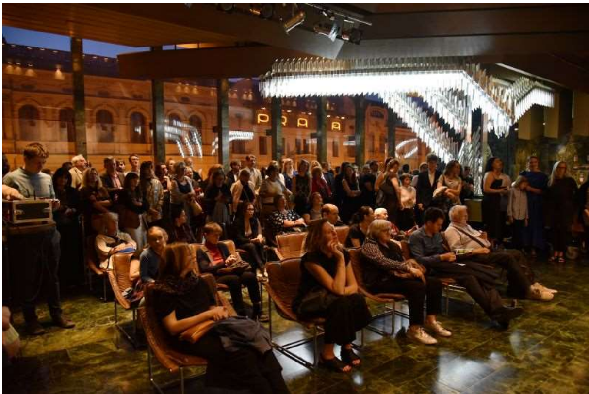
Beseda po představení Hora na Laterna festu