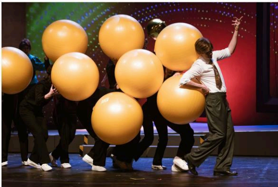
Z inscenace Tak se nám stalo...

Vůjtek si hraje se slovy, s ničím se příliš nemaže a nebojí se použít ani hrubozrný humor, aby postihl podstatu věci. Místy je jeho libreto až manýristické a marnotratné, přesto rozhodně převažují myšlenky, které jsou inspirativní, chytré a zábavné.