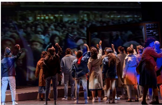
Z muzikálu Tak se nám stalo...

Příběh má z mého pohledu dvě drobná úskalí – je časově přetažený a postrádá svižnější tempo a dramatičtější spád. První polovina představení trvá bezmála hodinu a půl, druhé dějství zejména v závěru ztrácí dech a rozmělní se do jakési nostalgie, v níž ani smrt obou kamarádek neprobuď v divákovi větší emoce. Druhou věcí je přijatelná balance mezi humorem a vulgaritou, jakož i mezi ironií a oplzlou obscénností. Hoven a řiti na jednoho diváka je v tomto muzikálu docela dost.