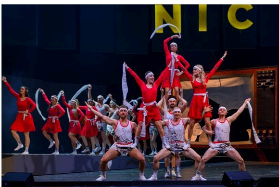
Z muzikálu Tak se nám stalo...

V jistém smyslu je muzikál Tak se nám stalo... jakýsi záměrně roztříštěným kaleidoskopem vzpomínek, jehož cílem není překvapit nečekanou pointou nebo šokovat, jako spíš podívat se na život z perspektivy a umět se nad všechny trampoty povznést. Respektovat změnu a přijmout prohru či blížící se smrt s klidnou myslí a mírem v srdci.