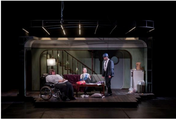
Z inscenace Velryba.

Za velkým úspěchem hry stojí především fakt, že autor dokázal velmi zdatně přetavit střípky ze svého života. Vyrůstal jako nevyoutovaný gay v Idahu, od centra veškerého dění, ve striktně křesťanské výchově. Nedobrovolné odhalení jeho totožnosti pak vedlo k depresím, deprese „léčil“ přejídáním se. Byť jeho tělo nedorostlo do velrybích rozměrů, jak tomu bylo u postavy Charlieho, musel překonat mnohé bariéry, aby dokázal vystoupit ze svého stínu. Právě proto dialogy postav nešustí papírem, ale jsou výsledkem dlouholetého pozorování a můžou tím lépe promlouvat i k nám, divákům. Každá z postav tak divákovi nabízí hluboký psychologický ponor. Prostřednictvím této psychologické sondy se nám postupně osvětluje ne vždy na první pohled srozumitelné jednání postav. A byť můžou mnohé scény vyznít melancholicky, celá inscenace je vlastně jednou velkou oslavou života a humanismu.