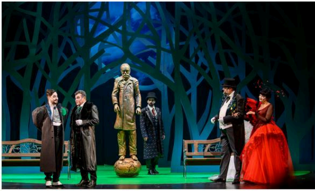
Z operní inscenace Hráč.