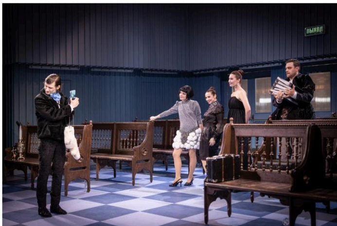
Národní divadlo moravskoslezské - Idiot

Umělecké vedení Městských divadel pražských projevilo zájem využít nově zrekonstruovanou kavárnu v Divadle ABC k divadelní produkci, a jelikož se původní text hry v kavárně odehrává, umístění se nabízelo takřka samo. Věřím, že nám autenticita místa pomůže navodit atmosféru, aniž bychom ji museli složitě konstruovat.