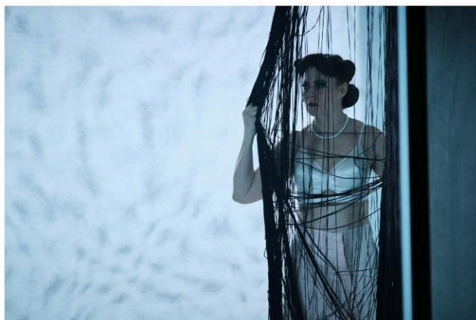
Národní divadlo Brno - Faidra (Zatmění)

Komornost textu přímo vybízí uvádět jej na malé scéně. Můžeme si tak dovolit větší míru civilnosti než na velkých scénách, kde jsem poslední dobou režíroval. A je to příjemná změna. Navíc kouzlo hry Ex spočívá především v brilantním trialogu. Je to takové to slovíčkaření vyšroubované ad absurdum. Suverénní interpretace textu je klíčovou složkou inscenace. Jde o hodně řemeslnou záležitost s důrazem na tempo a rytmus. Naším úkolem spolu se scénografkou Lenkou Hollou je pak přinést textu ještě audiovizuální nadstavbu, ale není třeba kolem něj příliš jevištně „čarovat“.