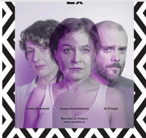
vizuál k inscenaci Ex