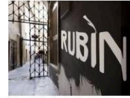
Divadelní studio Rubín