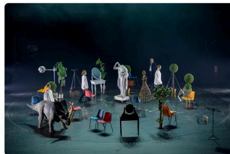
Z inscenace opery Elliotta Sharpa.

Jak už název opery napovídá, její obsah je věnován velkému nizozemskému židovskému filozofu Baruchovi Spinozovi (1632-1677). Substance ve Spinozově pojetí je všeprostupující podstatou, existující sama o sobě, nezávisle na světských či náboženských hierarchiích, substance jako projev Nekonečna. Tvto názorv stálv Spinozu vyloučení