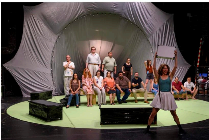
K ze zkoušky opery Klaun(i)