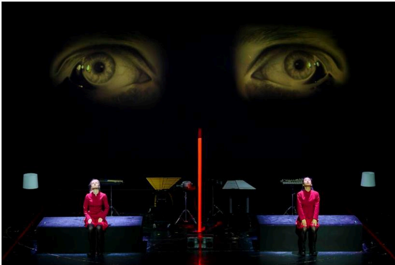
📸 z opery Company