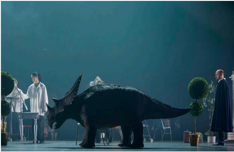
📸 ze zkoušky opery Substance