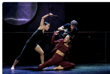
Z inscenace Babylon balet

Světová premiéra svým způsobem multizánrové inscenace s názvem Babylon balet s podtitulem Ztraceno v překladu v podání baletního souboru Národního divadla moravskoslezského se konala v sobotu v ostravském Divadle 12. Hlavním tématem nového jevištního díla je mezilidská komunikace a snaha o vzájemné porozumění.