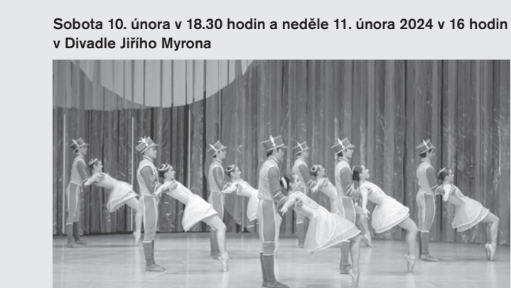
Členové baletu NDM

Sobota 10. února v 18.30 hodin a neděle 11. února 2024 v 16 hodin v Divadle Jiřího Myrona