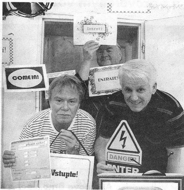
Hra Zlatí chlapani se často uvádí i pod názvem „...Vstupte!“. Na snímku propagační plakát ke hře.

Hra, uváděná v tuzemsku i pod názvem ...Vstupte!, pojednává o dvou hercích ve věku, kdy jsou za zenitem